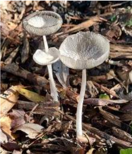
Hazenpootje ( Coprinopsis lagopus )