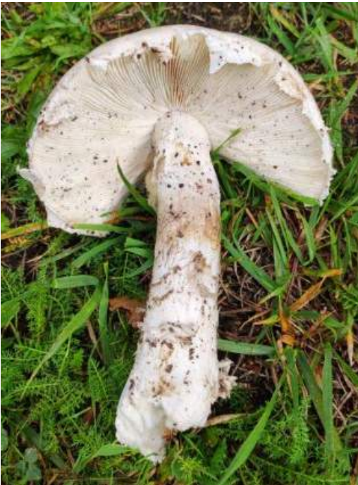
Franjeamaniet ( Amanita Strobiliformis )

Flammulina velutipes - Gewoon fluweelpootje Hymenopellis radicata - Beukwortelzwam Mycena acicula - Oranje dwergmycena Pluteus ephebeus - Spleijthoedhertenzwam Tubaria ferruginea - Roestbruin vloksteeltje Byssomerulius corium - Papierzwammetje Cerioporus varius - Waaierbuisjeszwam Cyanosporus subcaesius - Vaalblauwe kaaszwam Lentinus brumalis - Winterhoutzwam Peniophora lycii - Berijpte schorszwam Peniophora quercina - Paarse eikenschorszwam Leptosphaeria ogilviensis - Composietvulkaantje Bactrodesmium pallidum - — Chaetosphaerella phaeostroma - Zwarte viltzwam Torula herbarum - — Auricularia auricula-judae - Echt judasoor Myxarium nucleatum - Klontjestrilzwam