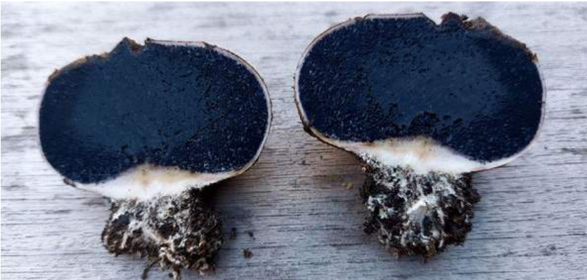
Kale aardappelbovist ( Scleroderma bovista ) op p. 42 en boven een doorsnede van een volgroeid exemplaar

20/09/2022 | De Blankaart, Woumen (Diksmuide)