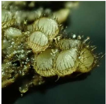
Links: Gekroond geleikelkje ( Cyathicula coronata ), Rechts: Gespeerd pelsbekertje ( Trichophaeopsis bicuspis )