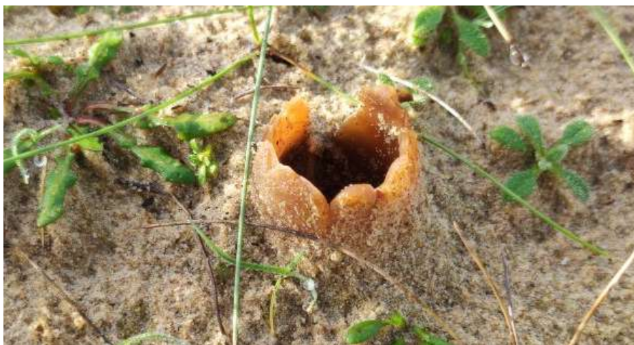
Zandtulpje ( Peziza ammophila )