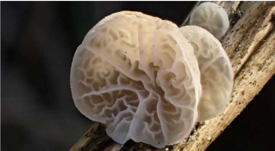
Gelatineschelpje ( Campanella caesia )