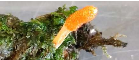
Rupsendoder ( Cordyceps militaris )

Psathyrella fusca - Beukenfranjehoed Psathyrella piluliformis - Witsteelfranjehoed Rhodocollybia butyracea - Botercollybia Rhopoglyphus filicinus - Varenstreepzwam Rickenella fibula - Oranjegeel trechtertje Russula adusta - Grofplaatrussula Russula cyanoxantha - Regenboogrussula Russula ochroleuca - Geelwitte russula Russula claroflava - Gele berkenrussula Xerocomellus chrysenteron - Roodsteelfluweelboleet Athelia decipiens - Gesploos vliesje Byssomerulius corium - Papierzwammetje Fomitopsis betulina - Berkenzwam Steccherinum ochraceum - Roze raspzwam Stereum hirsutum - Gele korstzwam Stereum gausapatum - Eikenbloedzwam Stereum subtomentosum - Waaierkorstzwam Cordyceps militaris - Rupsendoder Diatrypella favacea - Berkenschorschijfje Hymenoscyphus fructigenus - Eikeldopzwam Hypomyces chrysospermus - Goudgele zwameter Xylaria hypoxylon - Geweizwam Xylaria filiformis - Draadvormige geweizwam Cordyceps farinosa - Gewone rupsenzwam Trichoderma viride - Groen viltmatje Scleroderma areolatum - Kleine aardappelbovist Exidia nigricans - Zwarte trilzwam Spinellus fusiger - Mycenaparasiet