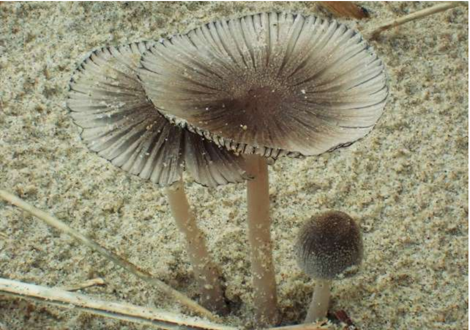
Helminktzwam ( Coprinopsis ammophilae )