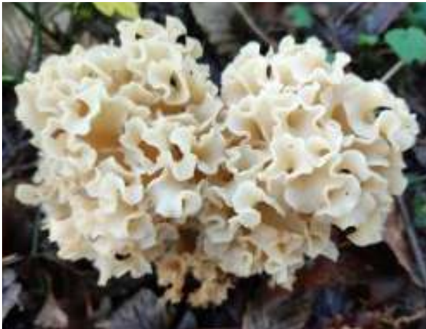
Sparassis crispa - Grote sponszwam

Boven: Gegordelde gordijnzwam ( Cortinarius trivialis )