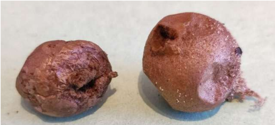
Melige bovist ( Bovista aestivalis )

Coniothyrium psammae - — Phoma ammophilae - — Montagnula perforans - — Rhytisma acerinum - Esdoornvlekkenzwam Bovista aestivalis - Melige bovist Tulostoma brumale - Gesteelde stuifbal