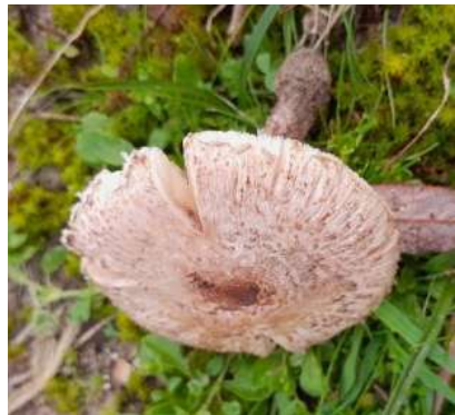
Zandparasolzwam ( Lepiota brunneoililacea )