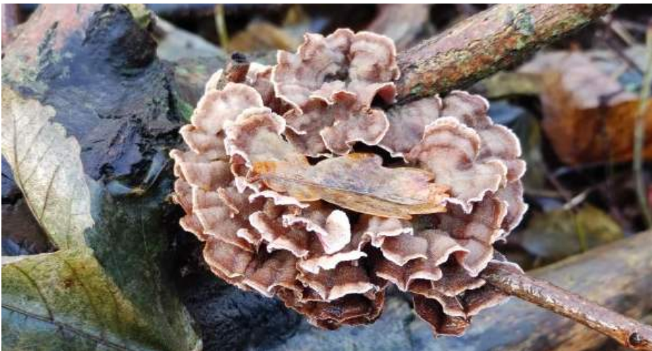
Paarse korstzwam ( Chondrostereum purpureum ), groeiwijze in rozet-vorm