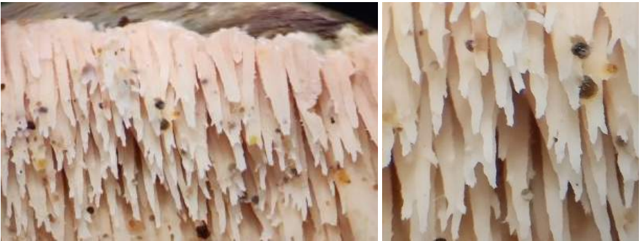
Bleke stekelkorstzwam ( Mycoacia aurea ) + detail