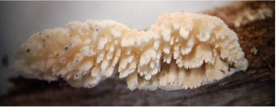
Melkzwam ( Irpex lacteus )