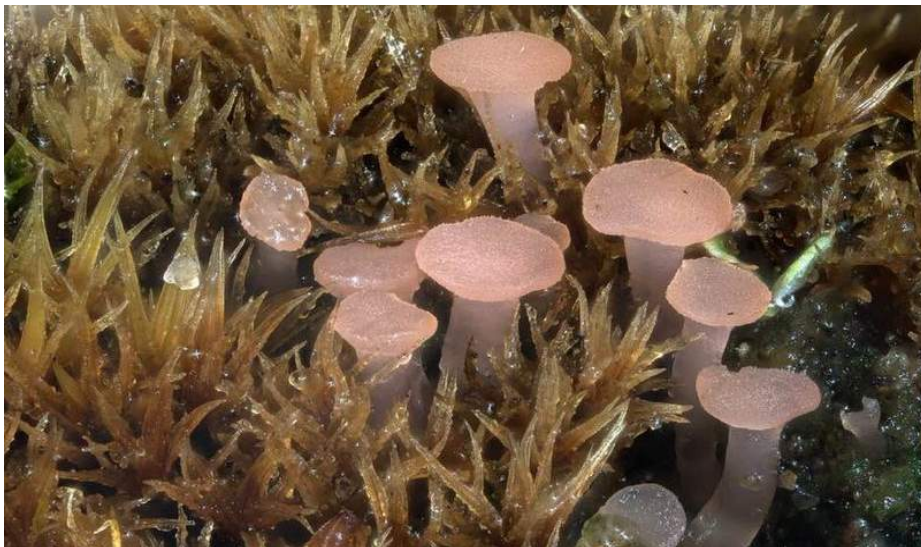
Roze grondschiifje ( Roseodiscus formosus )