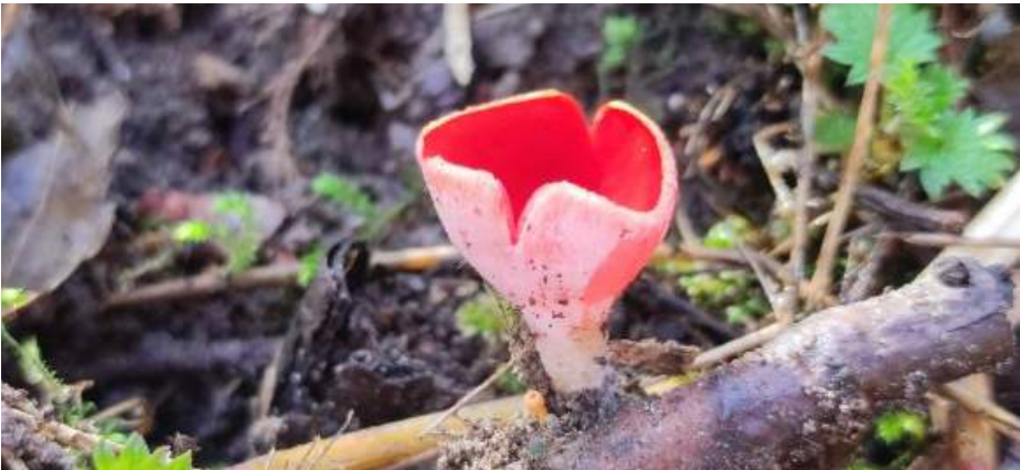
Rode kelkzwam ( Sarcoscypha coccinea )