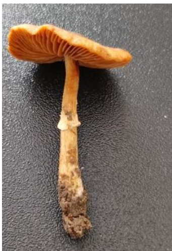
Geringd donsvoetje ( Tubaria confragosa )